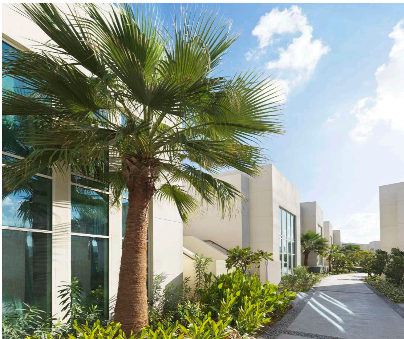
ВИЛЛЫ FAMILY VILLAS

InterContinental Ras Al Khaimah Resort & Spa Al Rafaa, Mina Al Arab P.O. Box 3001, Ras Al Khaimah, UAE